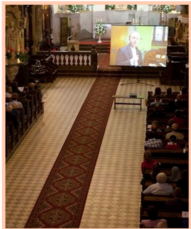
Transmisja obrazu ułatwia odbiór wizualny wirtuozerii organisty