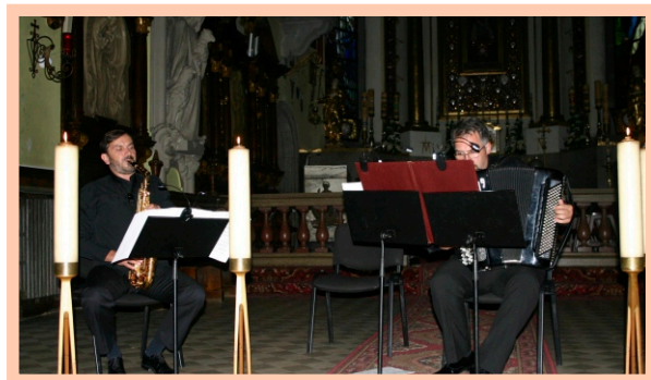
Podczas koncertów nie brakowało zaskakujących sytuacji. Jedną z nich był brak prądu, co zaowocowało muzycznym wieczorem przy świecach