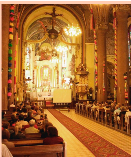
Niepowtarzalny klimat limanowskiej Bazyliki potęguje wrażenia artystyczne